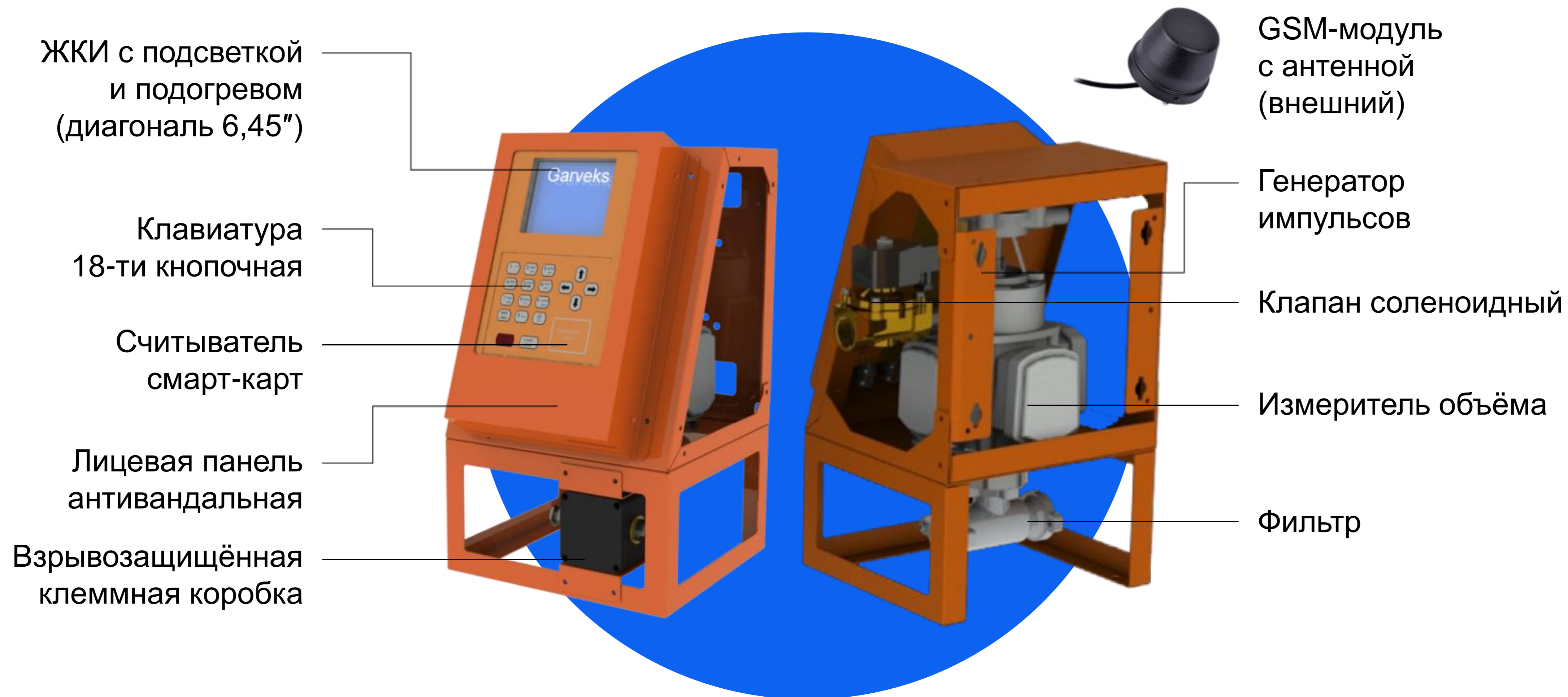
Схема для напорного исполнения